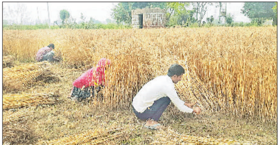
सोनीपत। ग्रामीण अंचल में पकी गेहूं फसल की कटाई करते किसान।

सड़क निर्माण के साथ सफाई का कार्य मंगलवार को शुरू करवाया गया है, जबकि बुधवार से जिले की चार मंडियों, एक साइलो के अलावा 15 खरीद केंद्रों में गेहूं की सरकारी खरीद शुरू करवाने के निर्देश दिए गए हैं। रोहताक रोड पर वर्ष 2000 में नई अनाज मंडी का निर्माण करवाया गया था। हर वर्ष मंडी से टैक्स के रूप में करोड़ों रुपये मार्केट कमेटी में जमा होते हैं। मार्केट कमेटी के अनुसार हर साल 13 लाख मीट्रिक टन अनाज की आवक होती है। हरियाणा राज्य कृषि विपणन बोर्ड की ओर से करीब 4 करोड़ रुपये से मंडी का कायाकल्प किया जा रहा है। 22 जनवरी के बाद मंडी में शोध बदला जा चुका है। अब सड़क व चाहरदांवरी का निर्माण जारी है।