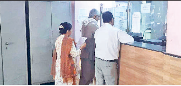
सोनीपत। नगर निगम कार्यालय में अंतिम दिन गृहकर जमा करवाते शहरवासी।

रेलवे रोड स्थित नगर निगम कार्यालय में गृहकर जमा करवाने का अंतिम दिन रहा। महावीर जयंती के अवसर पर मंगलवार आखिरी दिन 48 लोगों ने वित्त वर्ष के अंतिम 2.34 लाख दिन गृहकर जमा करवाने वाले प्रॉपर्टी करवाए गए। नगर निगम कार्यालय खुला रहा। मंगलवार को 48 लोगों ने कार्यालय पहुंचकर गृहकर जमा करवाया। अधिकारियों ने बताया कि अंतिम 2.34 लाख रुपये गृहकर जमा कराया गया। नगर निगम ने वित्त वर्ष में 40 करोड़ रुपये का राजस्व जुटाने का