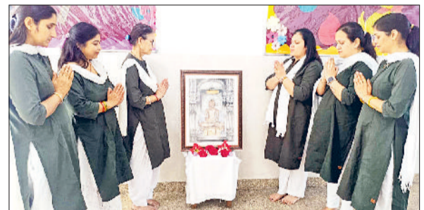
सोनीपत। महावीर की जयंती के अवसर पर प्रार्थना करती अध्यापिकाएं हुईं।