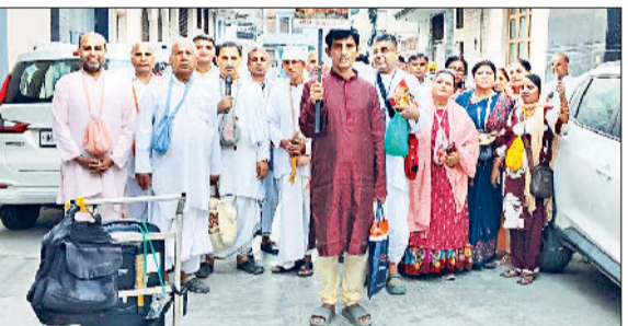
सोनीपत। हरिनाम संकीर्तन प्रभातफेरी निकालते इस्कॉन प्रचार समिति के सदस्य।