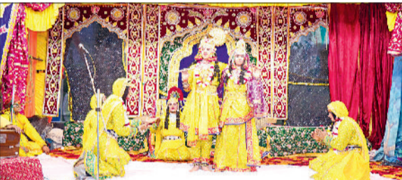
सोनीपत। श्री ठाकुरद्वारा पंचायती मंदिर में श्रीकृष्ण लीला का मंचन करते वृंदावन के कलाकार।