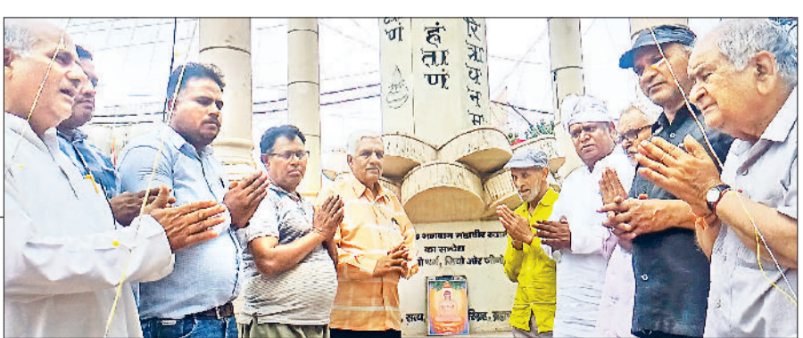
गोहाणा। भगवान महावीर का स्मरण करते हुए नागरिक।