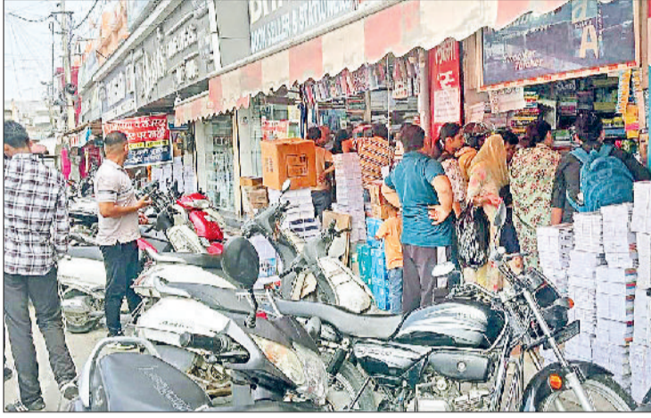
सोनीपत। गीता भवन चौक स्थित दुकान पर किताबें खरीदने के लिए लगी अभिभावकों की भीड़।

हालांकि नए शैक्षणिक सत्र 2026-27 के दाखिलों की तैयारी में जुटे जिलाभर के निजी स्कूलों के लिए विद्यालय शिक्षा निदेशालय की ओर से आवश्यक दिशा-निर्देश जारी किए गए हैं। निदेशालय की सख्त हिदायत है कि सभी निजी स्कूलों को एमआईएस पोर्टल पर ऑनलाइन माध्यम से 31 मार्च तक फार्म-6 जमा करवाना अनिवार्य है। इसके बाद ही स्कूल संचालक फीस की बढ़ोतरी कर सकते हैं, लेकिन सभी स्कूलों ने निर्देशों पर संचालन नहीं लिया है। नए सत्र में दाखिले के नाम पर हजारों रुपये की वसूली जारी है।