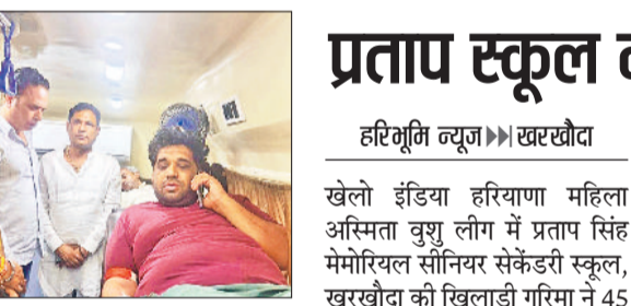
रक्तदाता को प्रोत्साहित करते शिविर आयोजक।