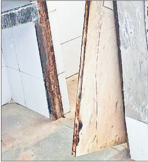
सोनीपत। मुरथल विश्वविद्यालय के छात्रावास में शौचालय का टूटा पड़ा दरवाजा व छात्रावास में खस्ताहाल लेंटर से उखड़ी पपड़ी व छात्रावास भवन की खस्ताहालत।

मुरथल स्थित दीनबंधु छोटा राम विश्वविद्यालय के छात्रावास (लड़कों के हॉस्टल) के विद्यार्थियों ने परिसर में अत्यंत खराब व असुरक्षित माहौल को लेकर चिंता जताई है। आरोप है कि विद्यार्थी यहां असुरक्षित माहौल में रहने को मजबूर हैं, जबकि उनसे हर वर्ष भारी शुल्क लिया जा रहा है। यही नहीं, छात्रों की हॉस्टल सिक्योरिटी भी पिछले 4 साल से लौटाई नहीं जा रही है। कुलपति ने 16 फरवरी को छात्र प्रदर्शन के दौरान एक माह के अंदर समस्याओं का समाधान करवाने का आश्वासन दिया था, लेकिन अब तक कोई कार्रवाई नहीं की गई है। विद्यार्थियों का आरोप है कि विश्वविद्यालय का हॉस्टल भवन अत्यधिक जर्जर स्थिति में है, जो किसी भी छात्र को गंभीर व खतरनाक स्थिति में पहुंचा सकता है। ऐसे माहौल में छात्रों के जीवन व सुरक्षा के लिए गंभीर खतरा बना हुआ है। सभी आवश्यक सुविधाओं के अभाव के कारण रहने का वातावरण भी असुरक्षित व अनुपयुक्त हो गया है। उधर प्रत्येक छात्र से 6100 रुपये प्रतिवर्ष हॉस्टल किराया लिया जाता है।