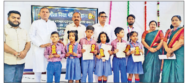
गोहाणा। मेधावी विद्यार्थी अपने गुरुजनों व अतिथियों के साथ।