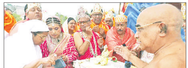
सोनीपत। कार्यक्रम के दौरान महाराज से आशीर्वाद प्राप्त करते हुए श्रद्धालु।