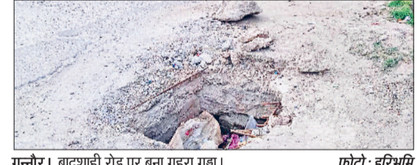
गनौरी। बादशाही रोड पर बना गड्ढा।

प्रत्येक नर्सरी में 25 खिलाड़ियों को प्रशिक्षण दिया जाएगा। खेल विभाग की ओर से 10 दिन पहले खिलाड़ियों की चयन प्रक्रिया पूर्ण की गई है। उधर विभाग को निजी नर्सरी के लिए 271 आवेदन प्राप्त हुए हैं। आवेदनों की जांच प्रक्रिया व निजी नर्सरियों का निरीक्षण करने के पश्चात विभाग की ओर से इन्हें मंजूरी प्रदान की जाएगी। बता दें कि प्रत्येक नर्सरी में 25 खिलाड़ियों को सुविधाजनक अभ्यास की व्यवस्था कराने के लिए खेल नर्सरी योजना प्रारंभ की गई है। योजना के तहत केवल ओलंपिक, एशियन एवं कॉमनवेल्थ खेलों में सम्मिलित चयनित खेलों के लिए ही सरकारी खेल नर्सरियां स्थापित की जाएंगी। योजना का मुख्य उद्देश्य प्रतिभाशाली खिलाड़ियों की